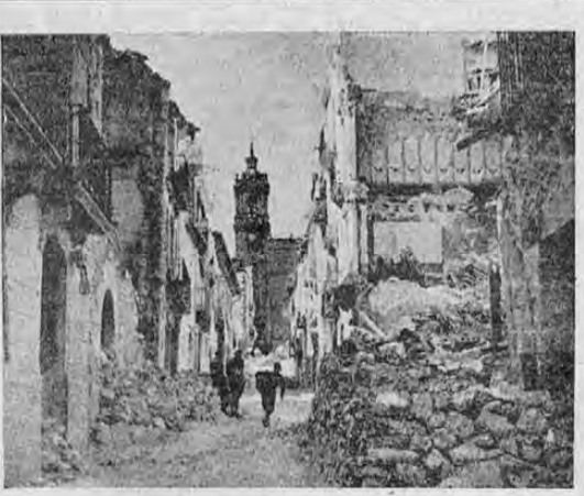
Una de las calles principales de la ciudad de Albocacer que cayó en manos de las fuerzas del General Aranda en su ofensiva a lo largo del Mediterráneo. Nótese la destrucción causada por la artillería antes de que los republicanos abandonaran la ciudadela que había sido convertida en una fortaleza por los defensores.

Negó Chamberlain que Italia hubiera condicionado la firma del convenio anglo-italiano a la victoria de los nacionalistas en España